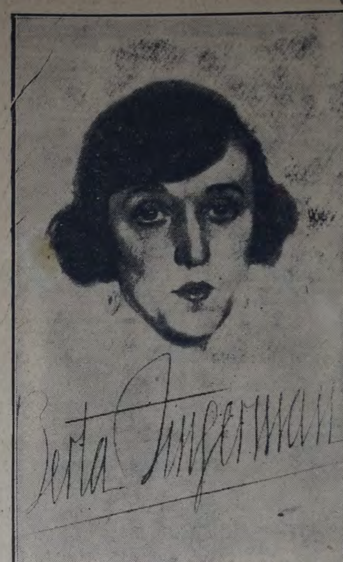
BERTA SINGERMANN, la conocida recitadora que ayer partió de esta capital para emprender una nueva gira por las principales ciudades europeas.

Durante la función del debut será representada las conocidas obras del género, tituladas "Los ojos con que me miras" y "El regalo de bodas".